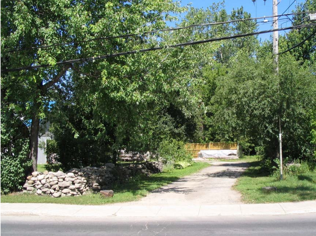
Old road intersection, looking north, between 12679 and 12661 Gouin (west of Valois).