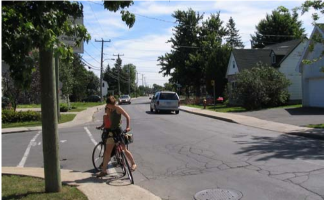
At Valois, looking east, à l'est