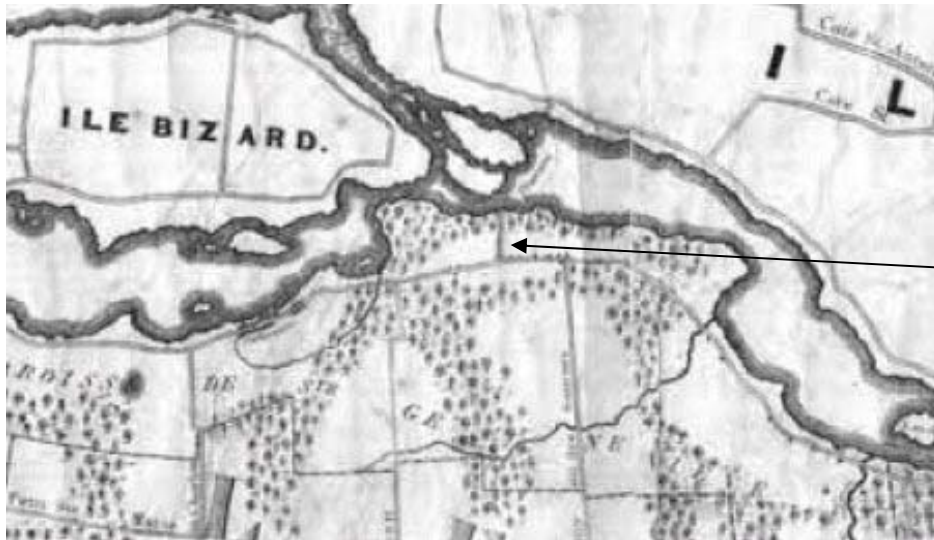
Map André Jobin 1834, showing road intersection, copy obtained from Évaluation Patrimoniale d'arrondissement de Pierrefonds – Carte André Jobin, 1834 montrant l'intersection routière.