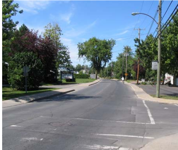
At Valois, looking west, à l'ouest