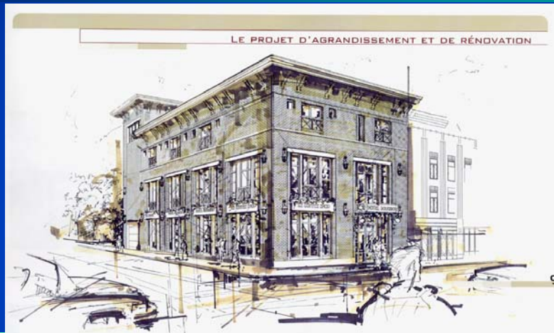
Figure 2 : Projet d'agrandissement

Le réaménagement de la rue Gareau, suivant les plans du promoteur, nécessite également une modification au plan d'urbanisme, aussi bien au niveau des affectations que de la hauteur. Le projet tel que présenté vise à réaménager la rue Gareau en café-terrasse et à remettre en état de parc la partie du parc Charles-S. Campbell présentement occupée par des installations de café-terrasse. Dans les documents présentés à l'appui de la demande, cette bande de parc est indiquée comme variant de 0,90 à 1,20 mètres. Lors de la séance publique, toutefois, la représentante de l'arrondissement a fait état d'une erreur de calcul, mentionnant que cette bande était plutôt de l'ordre de 3 mètres.