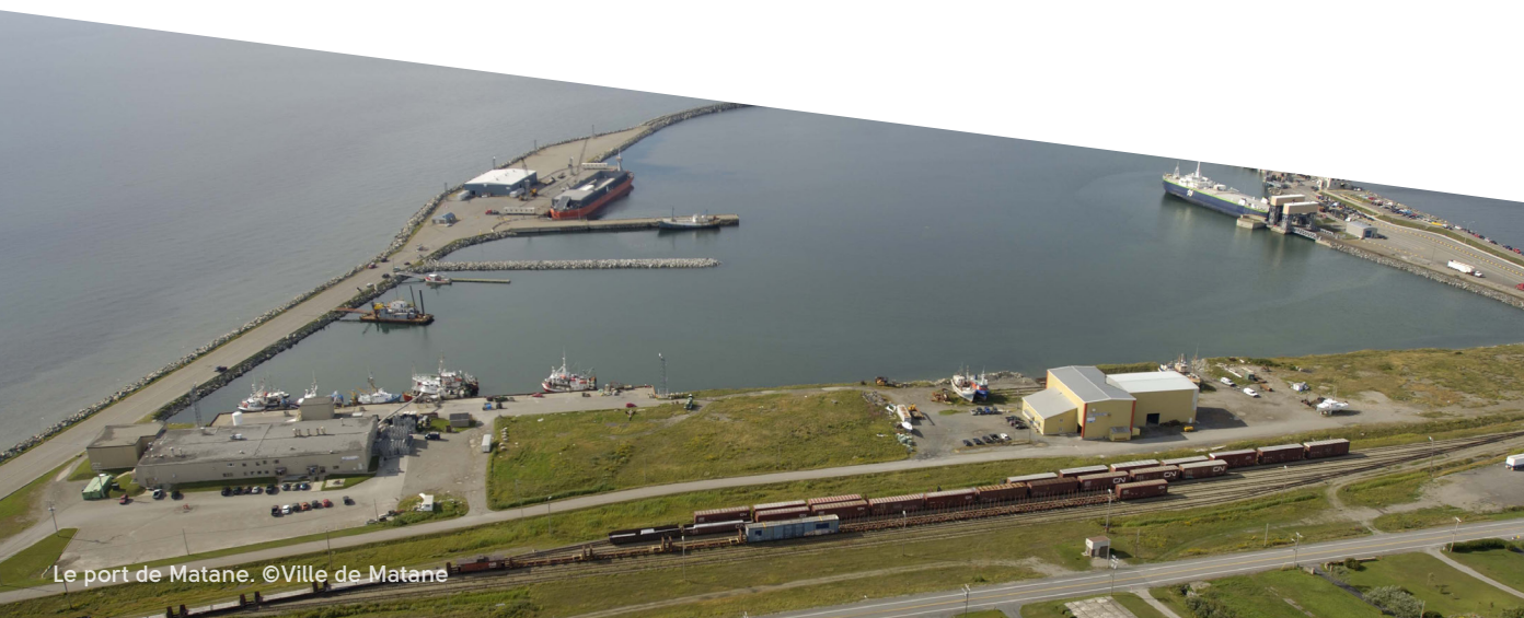
Le port de Matane.