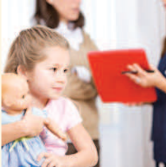
Enfant en attente de soins