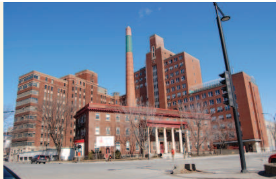
L'ancien HME vu du sud en 2015