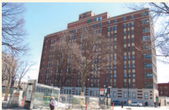
La façade nord du pavillon D en 2015