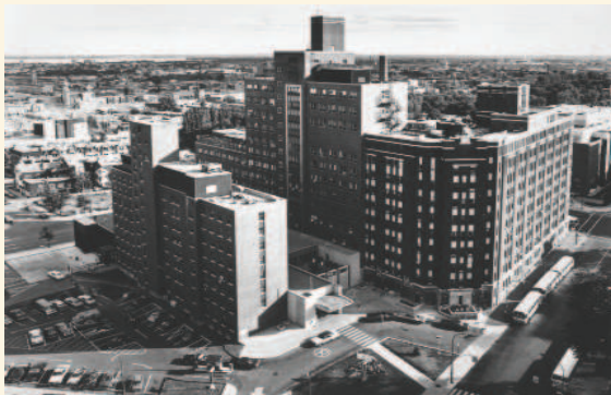
Le site en 1980, après la fin des travaux de l'aile B