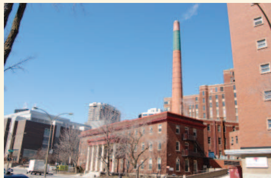
L'ancien HME vu du boulevard René-Lévesque Ouest

La valeur paysagère-urbaine de l'ancien Hôpital de Montréal pour enfants repose sur :