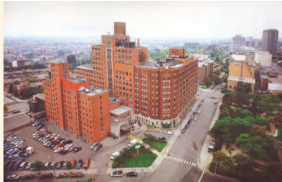
Vue aérienne du site de l'ancien HME