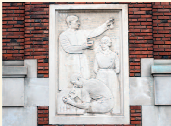
Un des deux bas-reliefs d'Henri Hébert sur le pavillon D