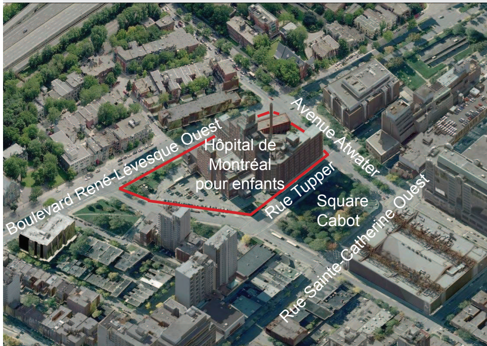
Photographie aérienne du secteur

Désignation patrimoniale fédérale : Aucune