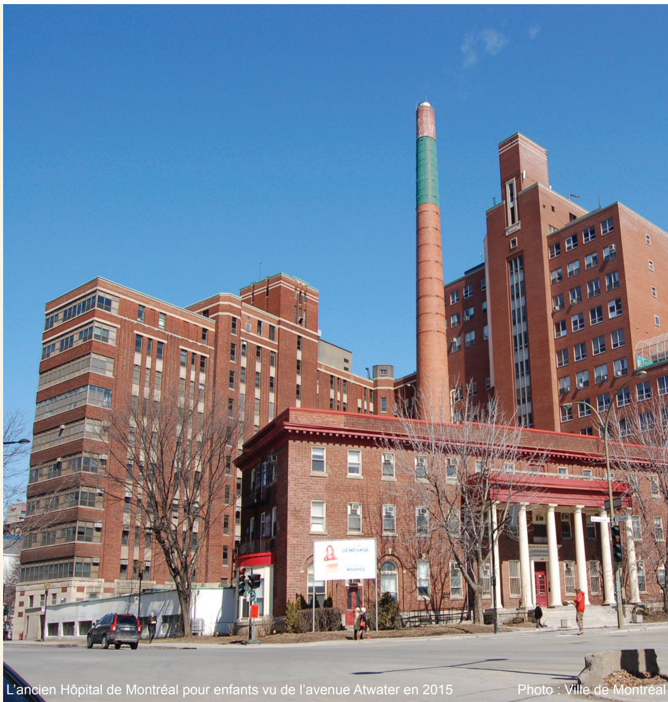
L'ancien Hôpital de Montréal pour enfants vu de l'avenue Atwater en 2015

Plusieurs Montréalais lui vouent un certain attachement, malgré le déménagement de 2015, en raison des soins et de l'attention qui y ont été portés à la clientèle particulière et fragile que sont les enfants.