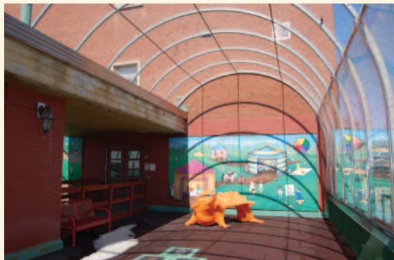
La terrasse de jeux sur le toit du pavillon C en 2015