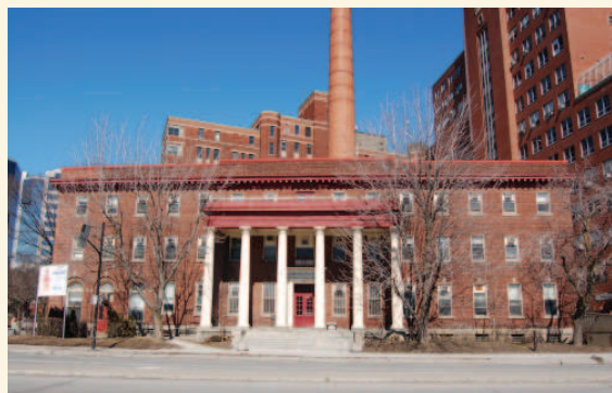
Le pavillon F en 2015

La valeur architecturale et artistique de l'ancien Hôpital de Montréal pour enfants repose sur :