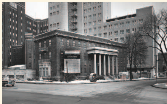
La résidence des infirmières (aile F) en 1956