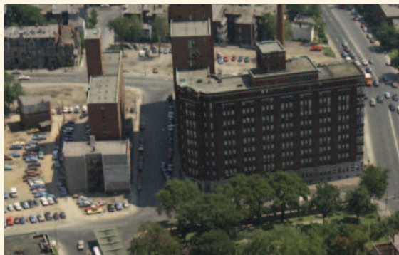
Le site en juillet 1969 illustrant l'ancienne rue Essex

La valeur historique de l'ancien Hôpital de Montréal pour enfants repose sur son témoignage :