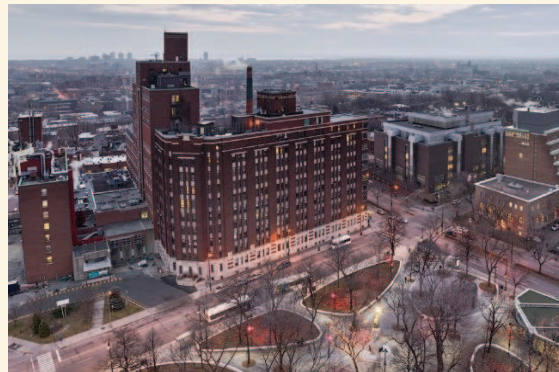
L'ancien HME vu du square Cabot Photo : Thomas Miaou (Affleck de la Riva, architectes)