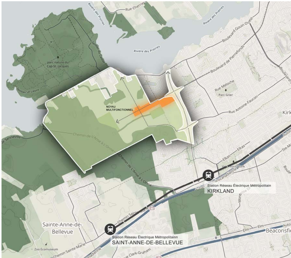
Plan de positionnement du futur noyau multifonctionnel du secteur Cap-Nature, en bordure du Boulevard Pierrefonds.

Comme les futurs commerces qui occuperont nos noyaux commerciaux seront principalement des commerces de proximité, de façon à avoir une offre diversifiée, il est essentiel que les quartiers qu'ils desservent soient représentatifs de toutes les tranches de la société. De manière à permettre cette représentation tout en s'inspirant de l'histoire du commerce en Amérique, nous avons pensé, à l'intérieur du projet Cap-Nature, à favoriser la superposition des usages. Ainsi à l'intérieur d'un même édifice, le long du boulevard Pierrefonds, il sera possible de retrouver des édifices ayant un usage commercial au rez-de-chaussée tout en ayant des usages d'affaire ou résidentiel aux étages.