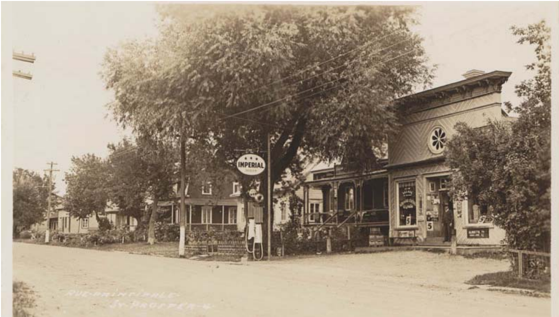
Image montrant la centralité du magasin général dans la trame urbaine

Tel que mentionné, l'usage commercial a toujours été présent dans nos sociétés et nos villes. Toutefois, la manière dont il s'est positionné à travers les différentes trames urbaines a beaucoup évolué en fonction des époques et de la taille des cités. Originellement, au temps de la colonie en Nouvelle-France, l'usage commercial entretenait un lien très étroit avec la fonction résidentielle. En effet, à cette époque et encore aujourd'hui dans les petites agglomérations du Québec, les commerçants ou les professionnels réservent un espace à l'intérieur de leurs résidences afin de réaliser leurs professions. Ainsi, il était possible de se rendre directement chez les personnes afin de bénéficier de leurs services. À cette époque, les usages résidentiels et commerciaux étaient fusionnés, en plus d'être très répandus géographiquement à l'intérieur des limites du village. Toutefois, dans l'organisation spatiale des villages, le magasin général devenait régulièrement dans la réflexion et l'idéologie des villageois, le centre de la ville, à titre de point de rencontre; l'église étant plus associée au symbole de la ville avec son clocher.