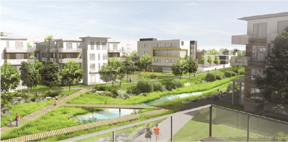
Vue de la première école primaire de Cap-Nature, à l'arrière plan, à proximité du noyau multifonctionnel.

En ayant pour objectif de venir occuper le centre de la ville et de symboliser ce dernier, nous croyons que le futur noyau multifonctionnel devrait dans un premier temps avoir une architecture significative de manière à en faire un élément phare dans le secteur de Cap-Nature. De la même manière nous croyons que ces édifices au point de vue des usages, devraient accueillir différents services municipaux et communautaires, en plus de la première des 3 écoles prévues dans le projet, de façon à devenir symboliquement un lieu de rencontre et d'information pour l'ensemble des résidents du secteur.