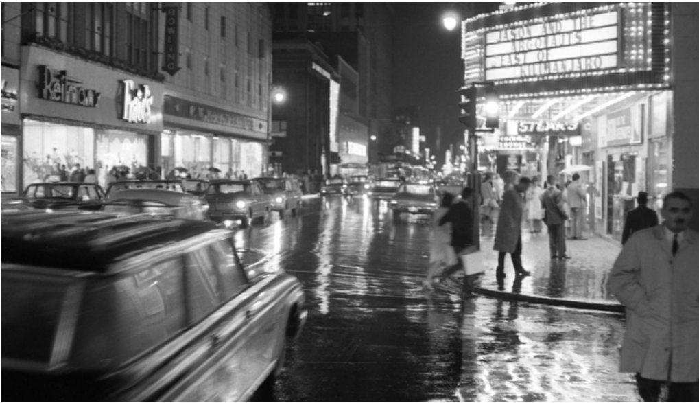
Image montrant l'activité sur la rue Ste-Catherine au tournant des années 60-70

pendant longtemps la destination pour faire des achats importants. Dans cet exemple, on peut voir que le commerce peut rendre une ville attrayante au point d'en faire des destinations, tel que ce fut le cas pour la rue Ste-Catherine ou encore la rue St-Hubert.