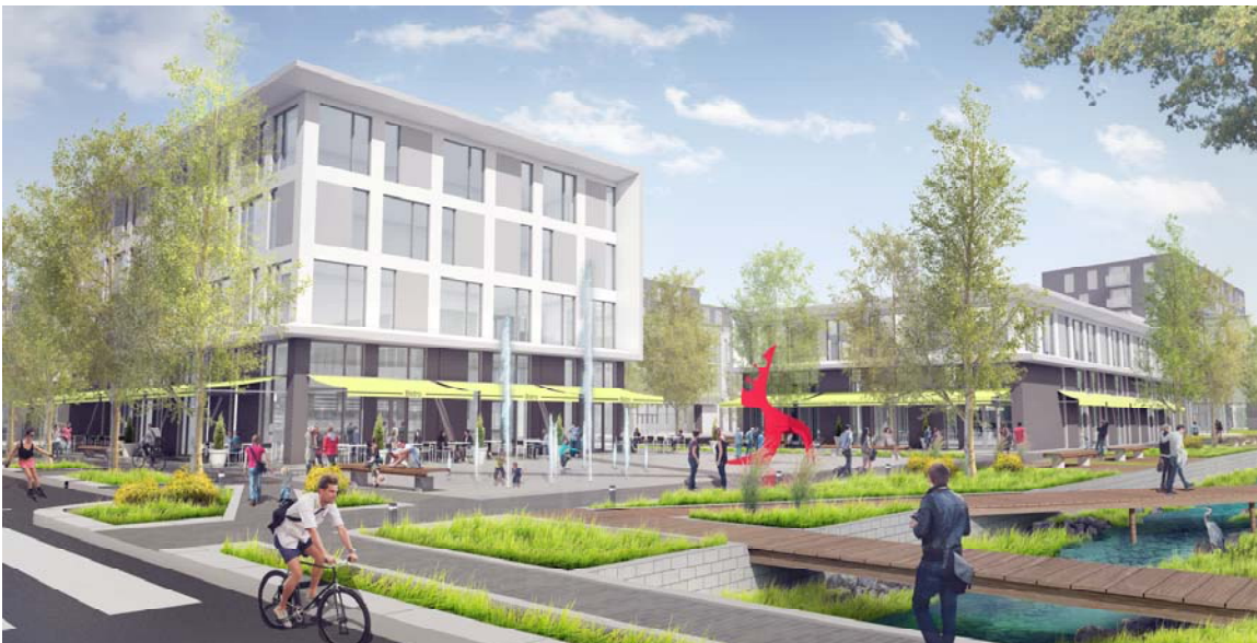
Exemple d'aménagement proposé pour le noyau multifonctionnel du quartier Cap-Nature

Comme vous avez pu le constater par l'historique de l'usage commercial et les intentions que nous vous avons présentées pour le développement du futur noyau multifonctionnel dans le secteur Pierrefonds-Ouest, le projet Cap-Nature a à cœur de venir s'inscrire en continuité de la tradition commerciale sur le territoire tout en proposant un modèle qui saura répondre aux besoins des générations futures.