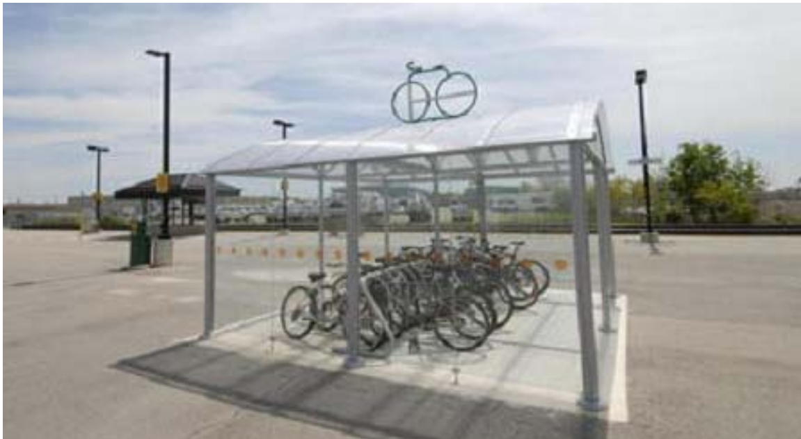
Exemple d'aire de stationnement pour vélo dans l'aménagement d'un espace public à Hamilton (Ontario)

Si la desserte en transport, principalement en matière de transport en commun, est importante dans le développement des nouveaux noyaux commerciaux par leur position au cœur des quartiers, l'intégration d'installations propices au transport actif est primordiale que ce soit par des stationnements pour vélo ou par des espaces aménagés afin de permettre aux piétons de traverser les différentes aires de stationnement pour véhicules en toute sécurité.