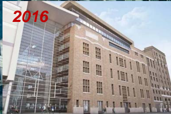
Carrefour d'innovation INGO - Phase II