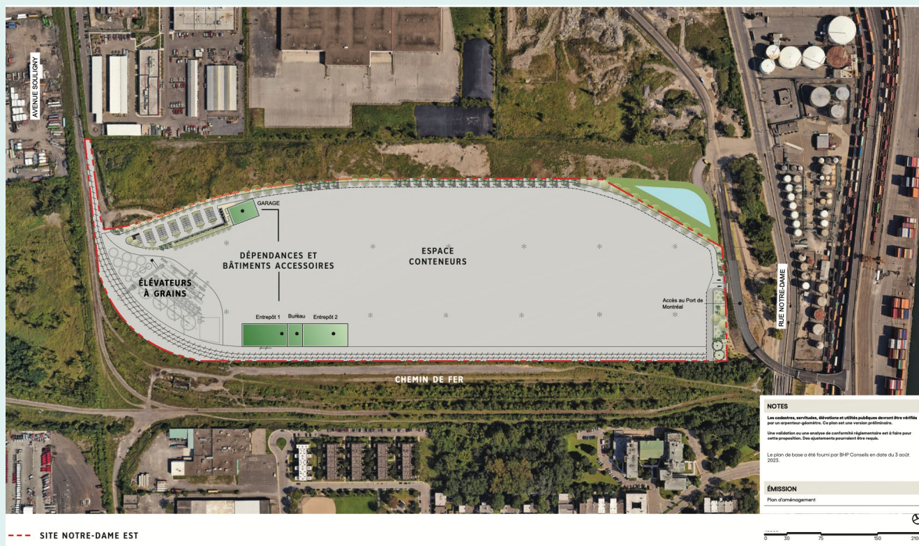
Figure 2 : Les grandes lignes de l'aménagement du site de RML sur la rue Notre-Dame Est.