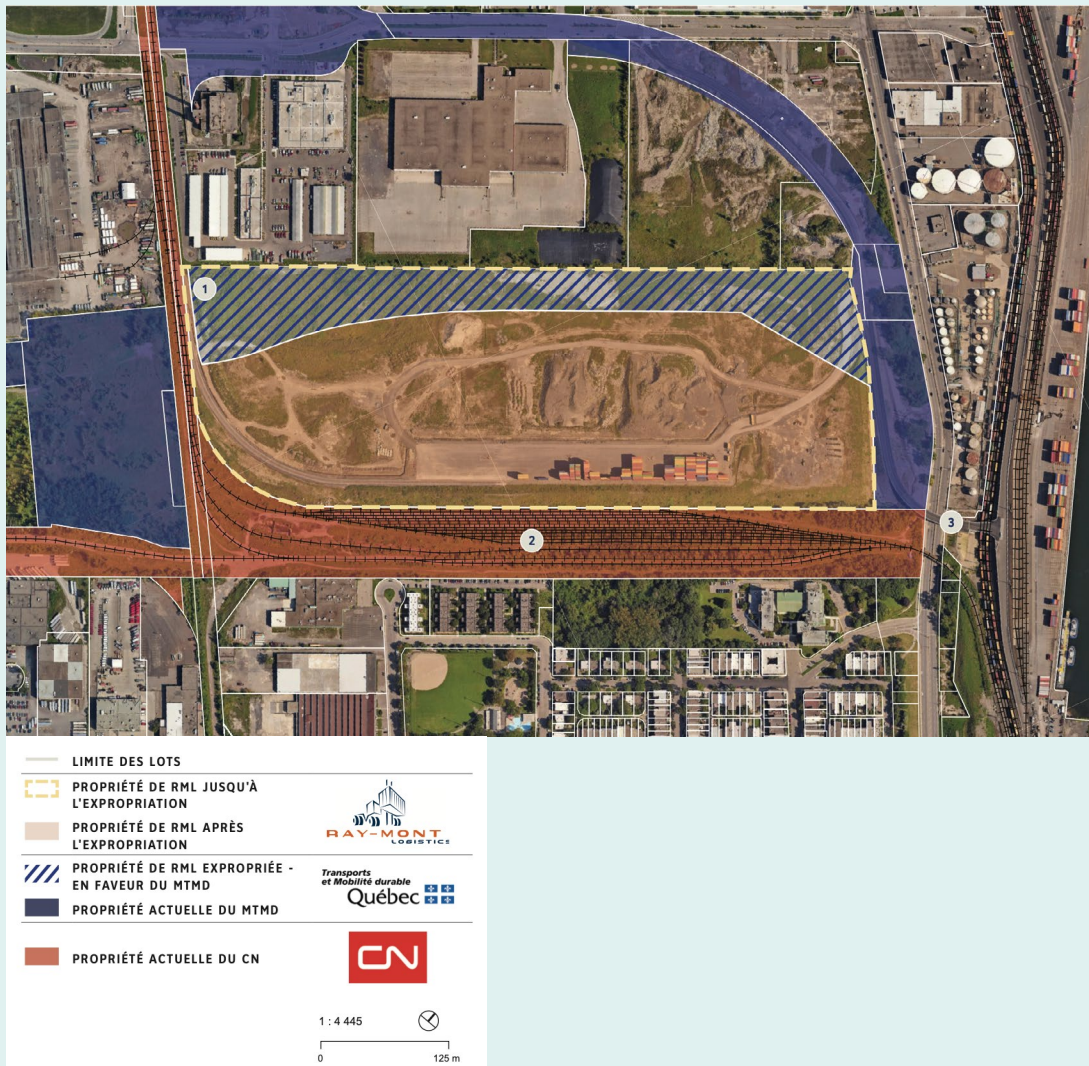
Figure 1 : Localisation du site RML de la rue Notre-Dame Est.

Comme le montre la Figure 1, l'aménagement du site et ses activités sont influencés par les interventions sur le territoire d'autres acteurs sur leurs propriétés respectives :