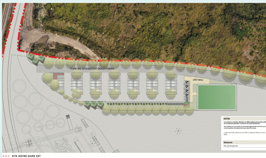
Figure 4 : Le stationnement.