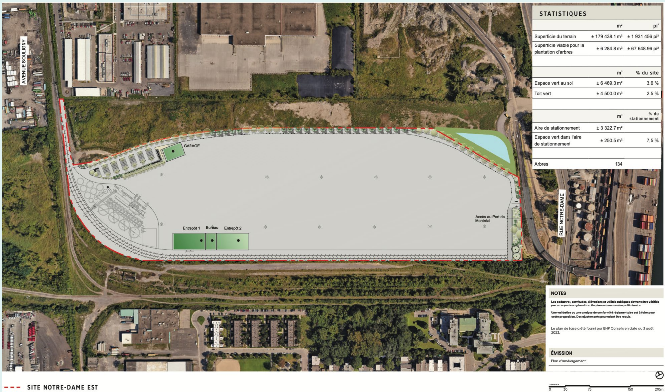
Figure 5 : Les espaces extérieurs.