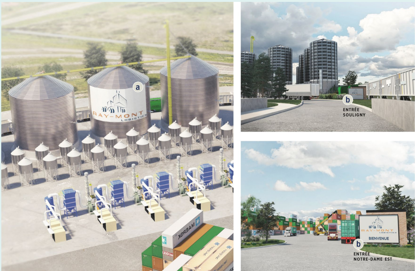
Figure 6 : L'affichage. Source : Ray-Mont Logistiques, doc. 3.1, p. 13