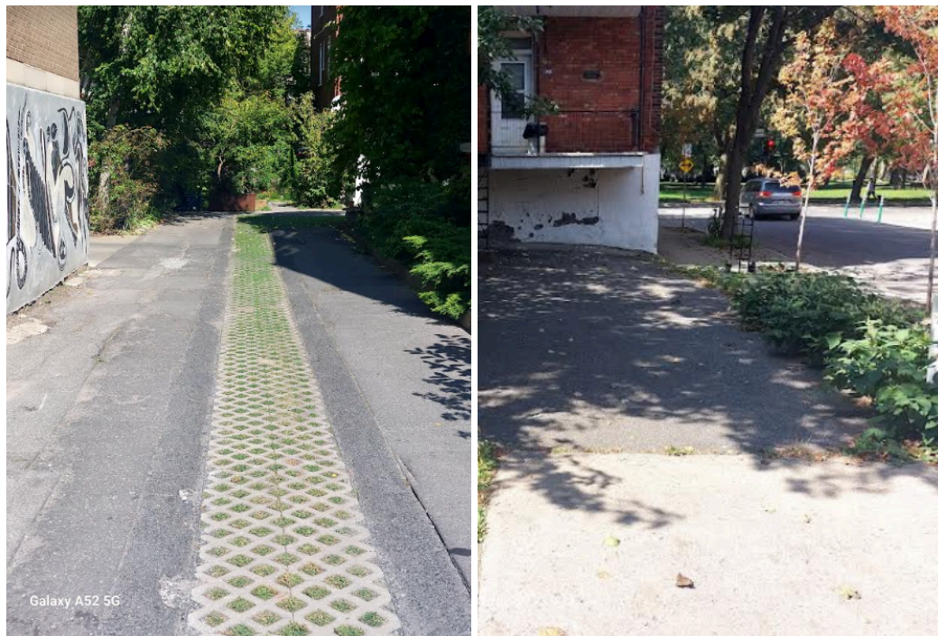
Photo 1 et 2 : Infrastructures légères mises en place dans les ruelles de Montréal: tranchée drainante (dalles engazonnées) (photo 1) et noue végétalisée (photo 2)

Il faut aussi accélérer la mise en place d'infrastructures vertes légères, telles que celles transmises dans les photos ci-dessous : tranchées drainantes et d'infiltration d'eau pluviale, noues végétalisées, etc., et tel que souligné dans l'objectif 5.3 du plan d'action. Les initiatives citoyennes à petite échelle, notamment dans les ruelles, devraient être admissibles aux programmes de financement des infrastructures vertes, mais les arrondissements doivent aussi se doter de plans de plantation.