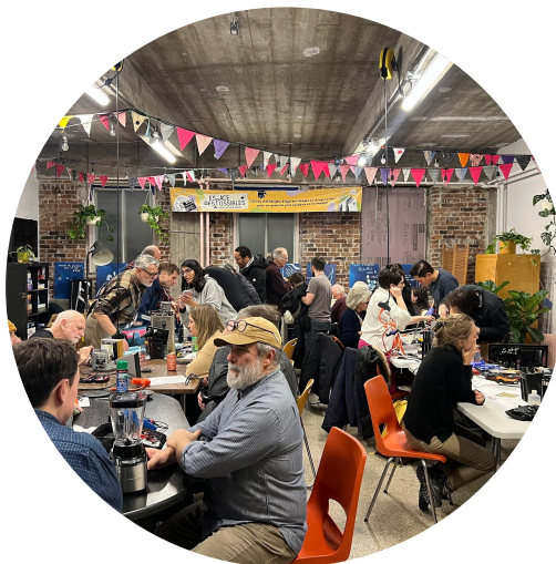
Volet Tiers-lieux et espaces autogérés