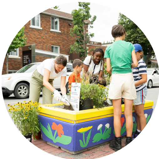
Volet Mieux-vivre avec moins d'autos