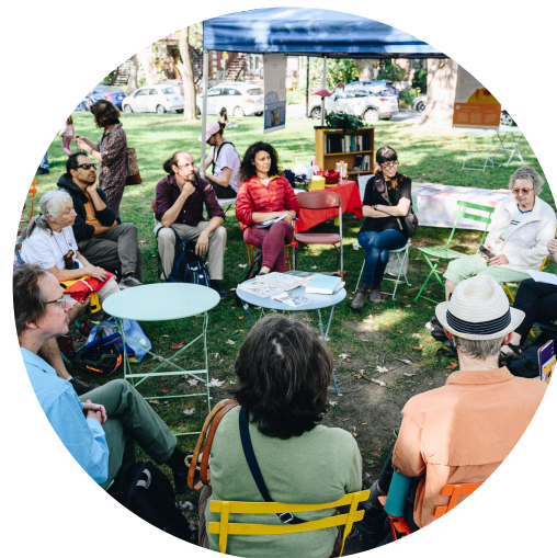
Volet Communautés des Possibles