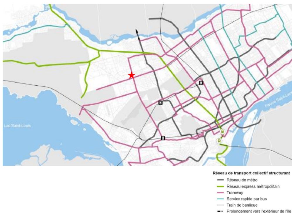
Figure 2, Carte 1-3 (chapitre 1) - Vision 2050 du réseau de transport collectif structurant

Le tramway est prévu à proximité du site en 2050, tel que montré à la carte 1-3 – Vision 2050 du réseau de transport collectif structurant du PUM, ci-dessous. Considérant qu'il s'agit d'un site bien desservi en transport en commun, la densité minimale brute projetée pour le site de 140 logement/hectares est relativement faible, surtout considérant que le Québec fait face, présentement, à l'une des pires crises du logement de son histoire. Il s'agit d'un site présentant un grand potentiel de développement, et donc un réel outil pour aider à contrer cette crise. Il est donc crucial que les orientations visant sont développement soient adaptées en conséquence.