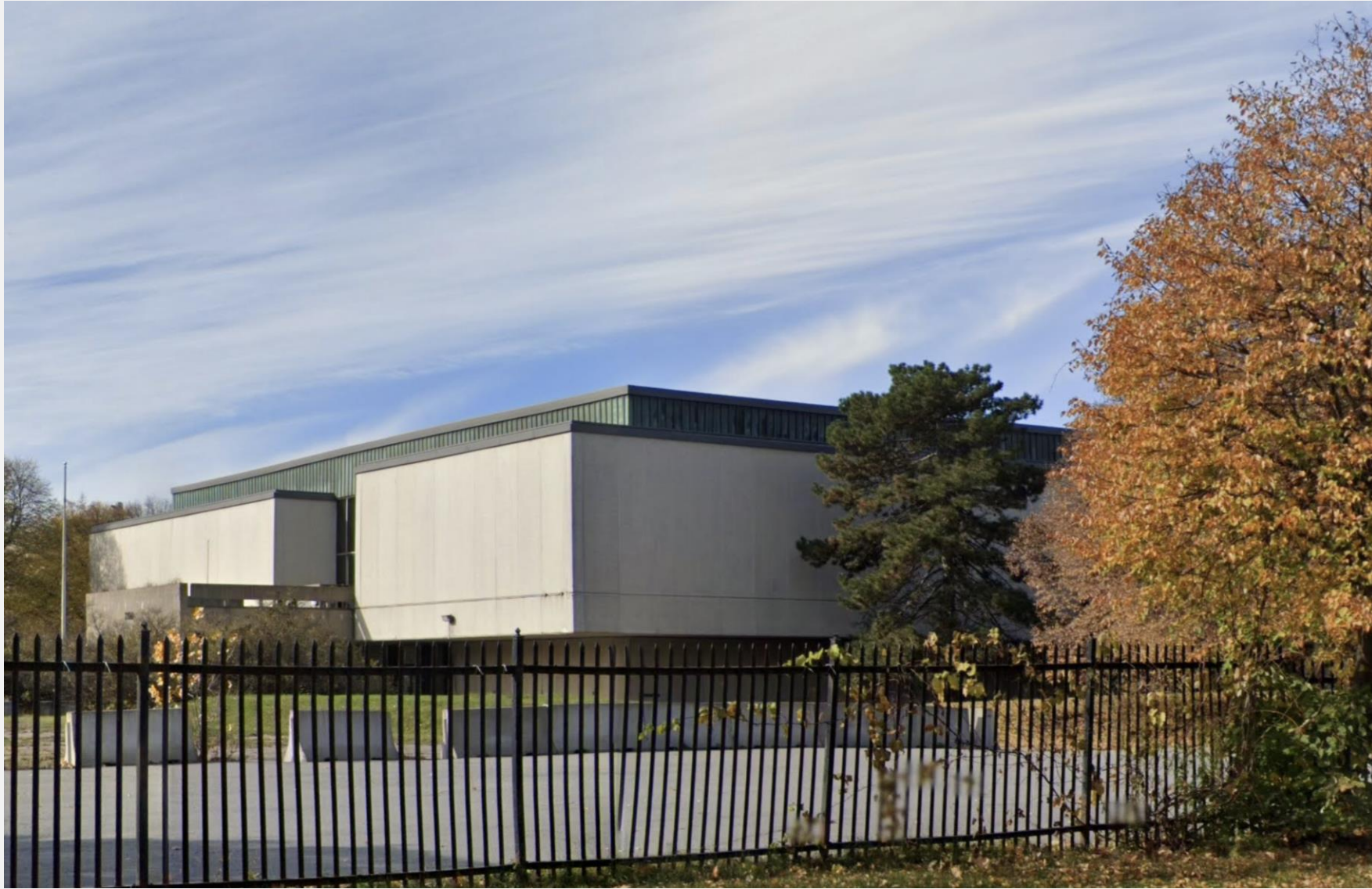
Musée d'art d'Expo 67