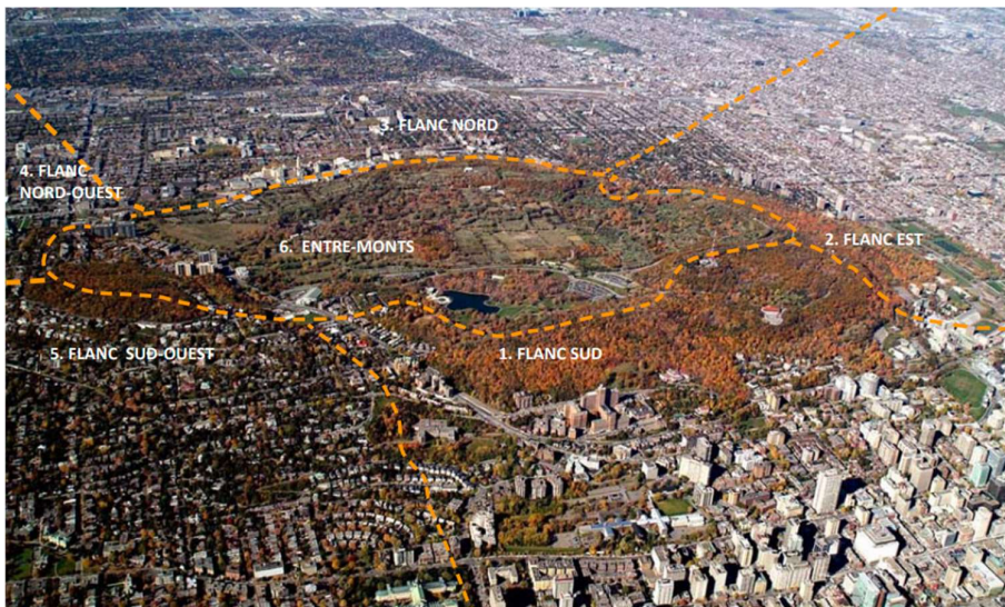
Figure 2. Les six grandes unités topographiques du mont Royal. Image tirée de l'Atlas du paysage du mont Royal (2012, p. 78). Ville de Montréal et ministère de la Culture, des Communications et de la Condition féminine du Québec.