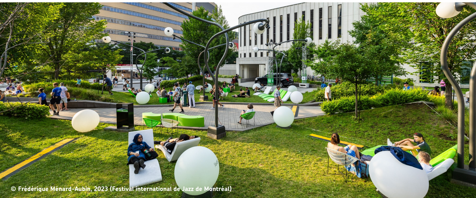
© Frédérique Ménard-Aubin, 2023 (Festival international de Jazz de Montréal)

serait incohérent avec les orientations et aspirations du plan, ainsi qu’avec les défis auxquels notre ville est confrontée. La désignation du secteur Place des Arts comme secteur d’opportunité permettrait d’envisager l’évolution de ce territoire à l’horizon 2050 et d’y affecter les ressources nécessaires. Ce grand chantier bénéficierait de l’expérience de ses intervenants déjà mobilisés, membres du Partenariat, qui, comme en témoigne la vision proposée, ont déjà des ambitions fortes pour la transformation du secteur.