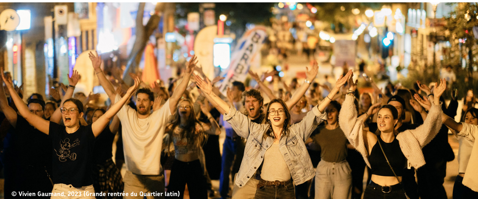
© Vivien Gaumand, 2023 (Grande rentrée du Quartier latin)

ayant un fort potentiel pour accueillir des secteurs de vitalité nocturne. Cependant, il est essentiel à ce stade de réitérer l'importance de ne pas concentrer l'entièreté de l'offre de ces secteurs au sein du Quartier, afin de préserver l'équilibre des fonctions et activités. Nous préconisons la désignation d'un réseau de secteurs de vitalité nocturne répartis sur l'ensemble du territoire montréalais. De plus, plusieurs actions doivent être envisagées pour assurer la fonctionnalité et le succès des secteurs de vitalité nocturne du Quartier. Les recommandations proposées par le Partenariat dans ce document concernent les dimensions urbanistiques et de mobilité. Aussi, nous estimons qu'il est important de se référer au mémoire déposé à la Commission pour comprendre pleinement notre position sur la vitalité nocturne .