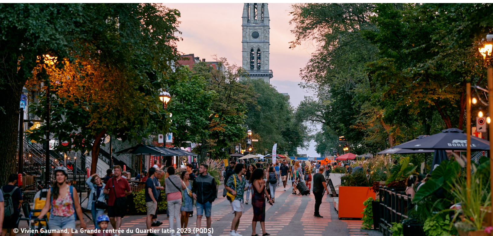
© Vivien Gaumand, La Grande rentrée du Quartier latin 2023 (PQDS)