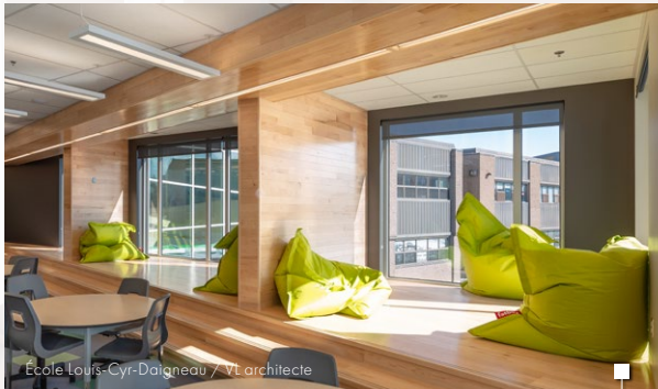
Ecole Louis-Cyr-Daigneau / VL architecte