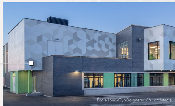
Ecole Louis-Cyr-Daigneau / VL architecte

L'utilisation originale de l'aluminium en parement