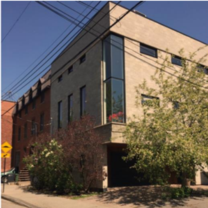
Figure 3 : Exemple de bâtiments existants

D'ailleurs, il importe de rappeler que les terrains sont privés et que des développements résidentiels seront soumis au Règlement pour une métropole mixte.