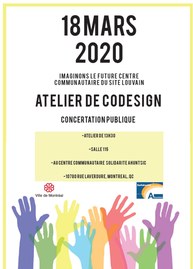
Figure 3 l'affiche de l'atelier de codesign

Lors de cette séance, les participants devront être regroupés en tables rondes animées par une équipe des stagiaires et des membres de Solidarité Ahuntsic dont Liliane et Siham font partie. Ils seront invités à se prononcer sur les besoins communautaires auxquels pourrait répondre le futur centre à travers plusieurs activités interactionnelles ( voir figure 3 ), ainsi que son mode de gouvernance.