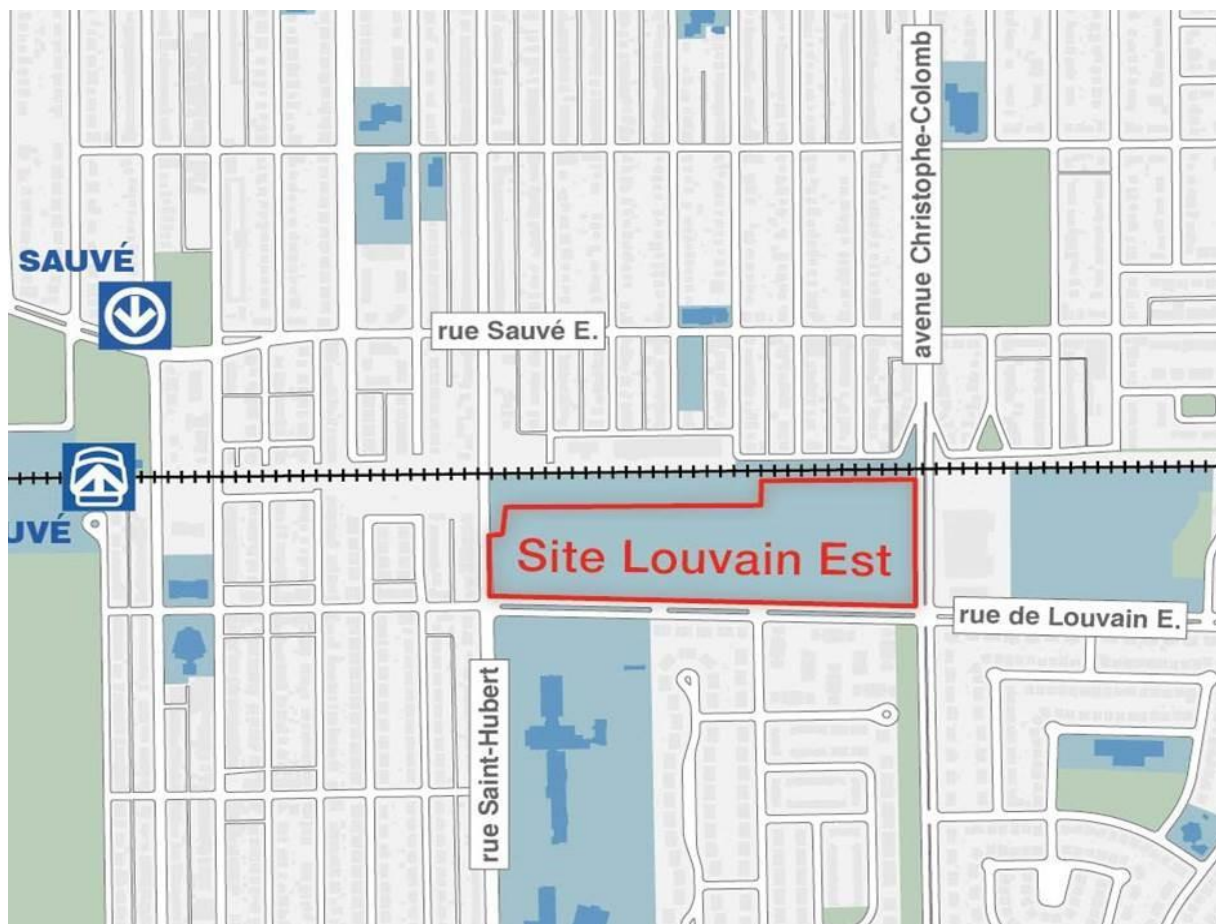
Figure 1 : Carte du site Louvain Est et ses environs

Le site Louvain Est fait l'objet d'une importante mobilisation citoyenne depuis plus d'une décennie. La planification est réalisée par un bureau de projet réunissant des représentants de la Ville de Montréal, de l'arrondissement d'Ahuntsic - Cartierville et du comité de pilotage mis sur pied par la table de concertation Solidarité Ahuntsic. Cette gouvernance partagée est un projet pilote qui a le potentiel de devenir un modèle en matière de démocratie participative dans les projets urbains.