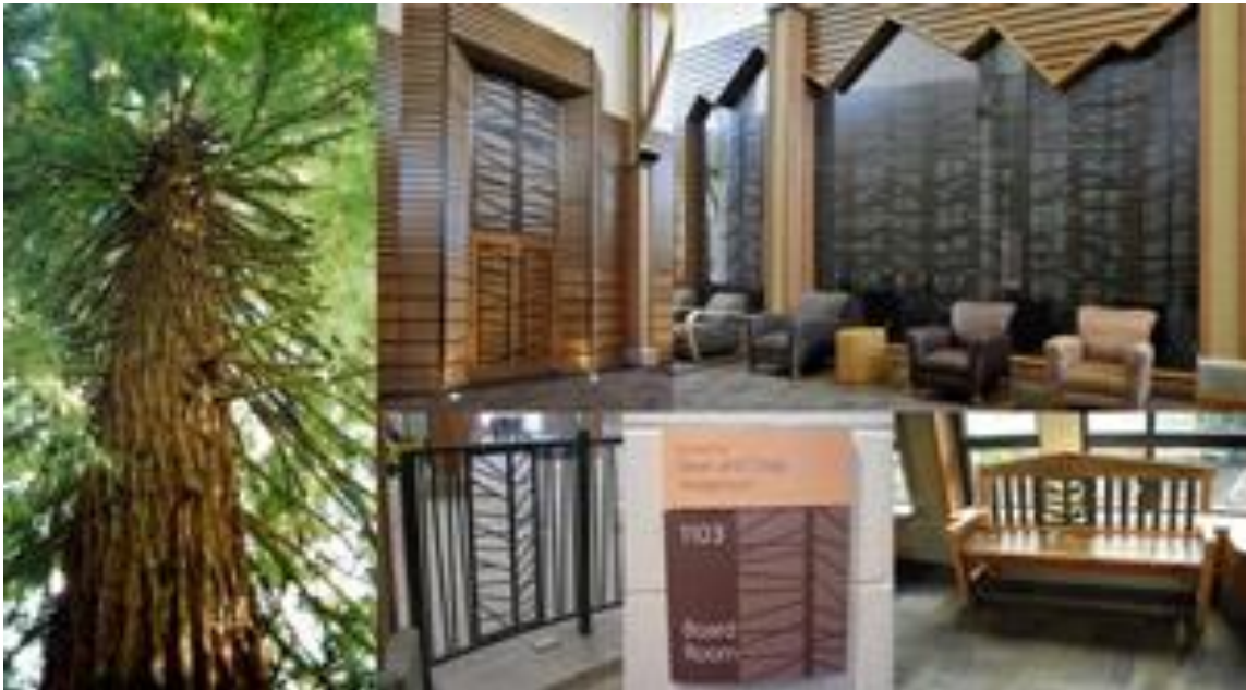
Figure 6 : centre communautaire du corps Ray & Joan Kroc de l'Armée du Salut de la ville

Presque toutes les communautés contiennent des éléments naturels, historique ou culturels facilement reconnaissables et identifiables, tels qu'une caractéristique géographique distincte, une culture agricole spécifique élevée dans la région, un festival ou un événement, une mascotte, des plantes ou des animaux indigènes, des événements ou monuments historiques . L'intégration de ces caractéristiques dans la conception renforce le sentiment d'appartenance à un endroit particulier et crée un lieu dans lequel la communauté se réunit pour socialiser et recréer.