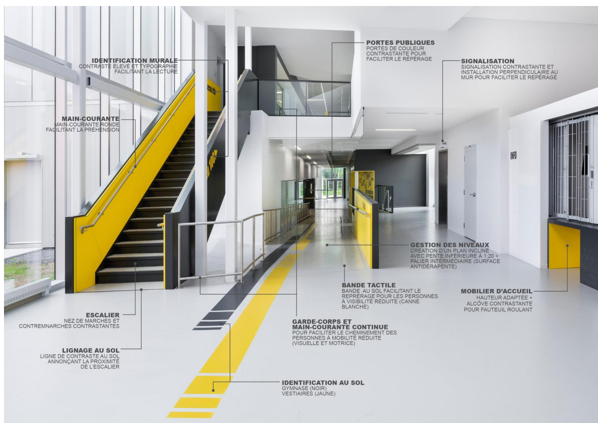
Figure 5: centre communautaire LeBourgneuf

La couleur façonne les environnements et crée des sentiments ou des attitudes spécifiques. Le rouge, par exemple, est une couleur émotionnellement intense, tandis que le bleu est apaisant et paisible. Lors de la sélection des couleurs environnementales, il faut tenir compte des activités qui se déroulent dans chaque espace. Le marquage de su sol est aussi un élément important surtout pour les personnes vulnérables.