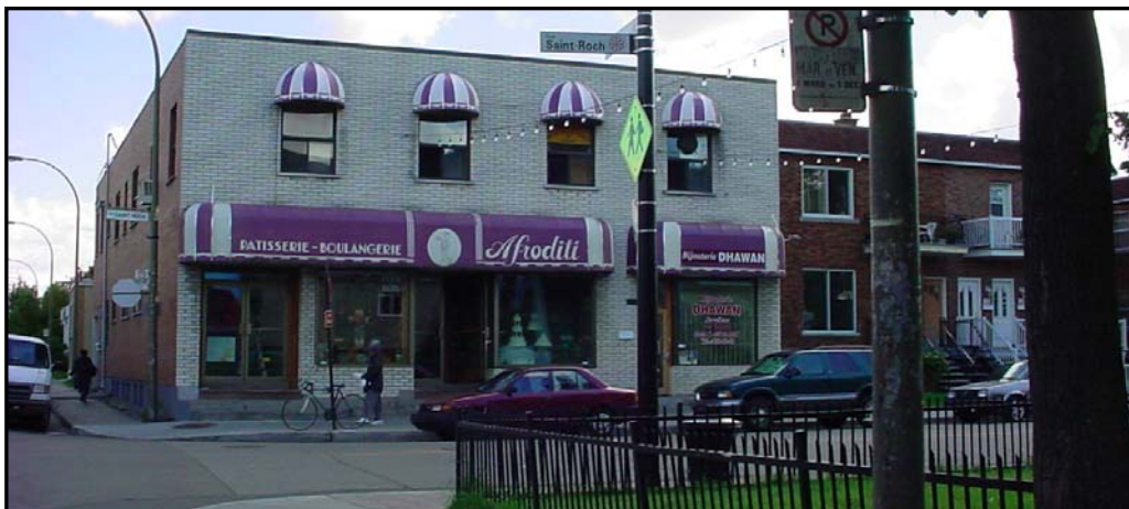
Figure 1 Immeuble de la Pâtisserie-Boulangerie Afroditi visé par le projet de règlement P03-022 (extrait du document déposé no 5.1, diapositive no 3).

Le 27 mars, la commission a tenu une rencontre préparatoire avec monsieur Benoît Lacroix, chef d'équipe et responsable du dossier pour l'arrondissement. Cette rencontre visait surtout à discuter du dossier de documentation accessible au public. Le lundi 7 avril, la commission a tenu une assemblée publique de consultation au Centre William-Hingston situé au 419, rue Saint-Roch. Le propriétaire de la pâtisserie-boulangerie et un résidant du quartier ont participé à la consultation.