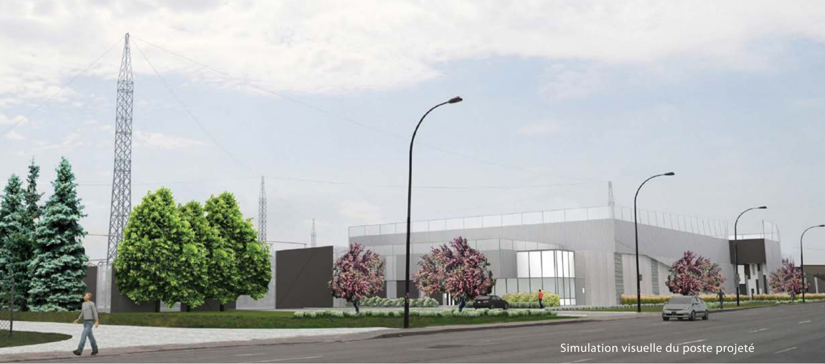
Simulation visuelle du poste projeté