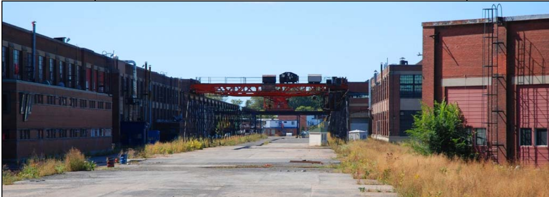
Bâtiments en rangée, 2009-septembre-19 : un trésor patrimonial à préserver pour tous.

Cette allée est un bijou. Doit-on y favoriser l'implantation de commerce de proximité au détriment de Wellington? Mixité d'habitat? La réponse est vaste. Supermarché, promenade, piste cyclable, terrasses et restaurant? Quel que soit le modèle retenu, il faut la mettre en valeur sans en faire un lieu privé.