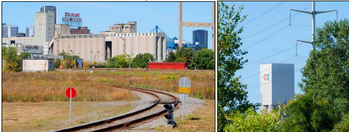
Céréales, réseau ferroviaire, vitre et transport d'électricité, 2009-septembre-19 : Des emplois.

Nier la vocation industrielle du secteur est impossible.