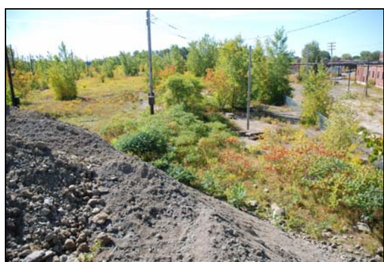
Travaux, 2009-septembre-19 : le tas, prise 3, prise 4.