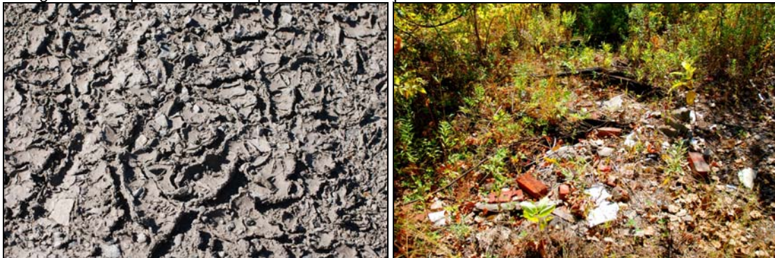
Exemples de sols, 2009-septembre-19 : Il ne me viendrait pas spontanément à l'idée d'y planter des tomates.

Il est également impossible de nier que les sols soient pollués.