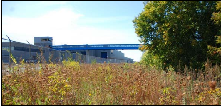
Passerelle d'accès aux installations, 2009-septembre-19 : un passage protégé nécessaire.

Pour préserver la sérénité du secteur, il faut éviter de transformer l'enclave en corridor pour la circulation automobile. Mais rien n'empêche de relier le quartier aux environs par des pistes multimodales pour non motorisés. La zone des ateliers est un obstacle majeur présentant de nombreux dangers. La passerelle surplombant l'entrée sur Dick-Irvin témoigne de cette dangerosité. Il est nécessaire de construire un pont piétonnier pour accéder aux rives du fleuve. Les gens seront moins tentés de faire des trous dans la clôture s'ils peuvent traverser en toute sécurité.