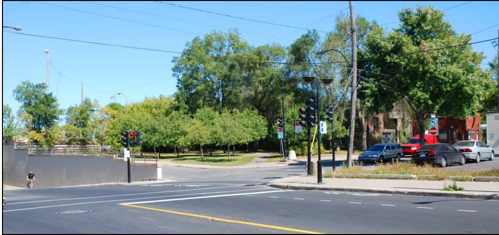
Parc de la Congrégation, 2009-septembre-12 : un parc discret.

Ces projets domiciliaires auront un impact sur la rue Wellington. Pour éviter qu'ils soient négatifs et permanents, il faut conserver le parc de la Congrégation. C'est un havre de paix discret avec de beaux arbres.