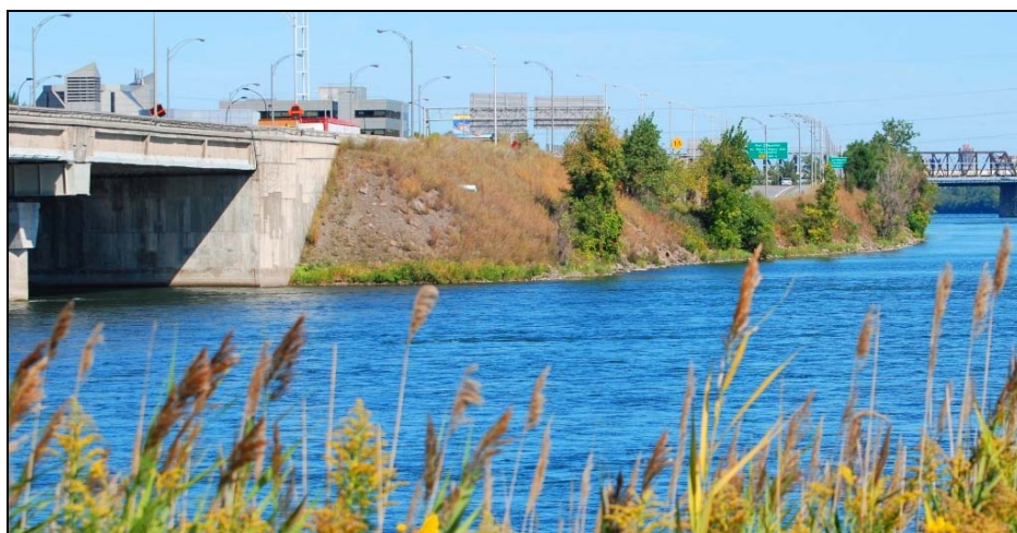
Rive du fleuve Saint-Laurent, 2009-septembre-19 : Un pont qu'il faudra rendre accessible aux piétons pour relier la Pointe Sainte Charles à la très voisine Île des Sœurs.