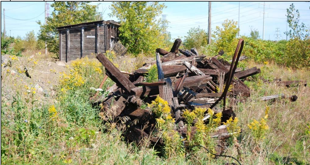
Sur le site pour développement, 2009-septembre-19 : Tas et cabane.

Dans la partie des projets de développement domiciliaire, c'est différent.