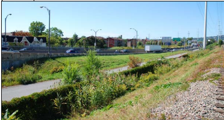
Corridor vert, 2009-septembre-12 : Un nouvel usage pour un espace coincé entre une autoroute et une voie ferrée. Pourquoi pas?

En ajoutant la piste projetée au nord des ateliers, une connexion avec les rues Bridge et Des Moulins et un accès à un éventuel corridor vert qui longerait l'autoroute 15-20, le quartier deviendrait un carrefour récréatif et utilitaire pour cyclistes et piétons.