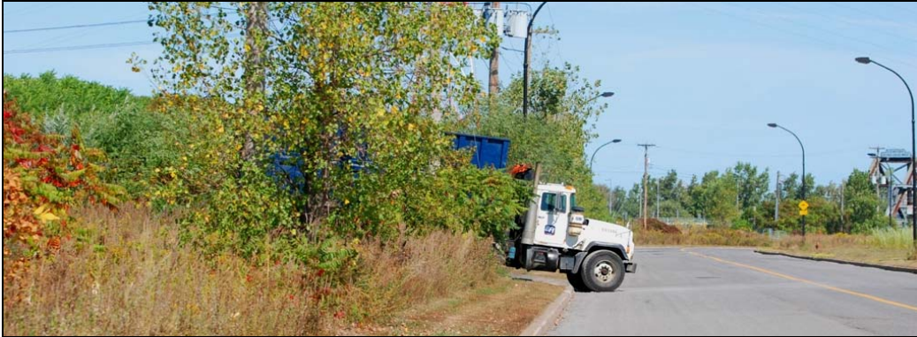
Accès au site, 2009-septembre-19 : Sortie des camions avec camion.

J'ai pu accéder aux terrains des ateliers deux fois sans rencontrer un seul panneau d'interdiction, sans sauter de clôture, ni passer par une ouverture artisanale. La deuxième fois, j'y ai passé plus d'une heure sans que personne me remarque. J'ai dû m'asseoir en plein milieu des voies et attendre environ dix minutes pour attirer l'attention. Un employé s'est approché de moi. Il m'a informé que j'étais dans un lieu privé et dangereux et que je risquais une amende. Je lui ai fait remarquer qu'au nord du terrain, il existait des ouvertures dans la clôture et de nombreuses pistes façonnées par passage répété.