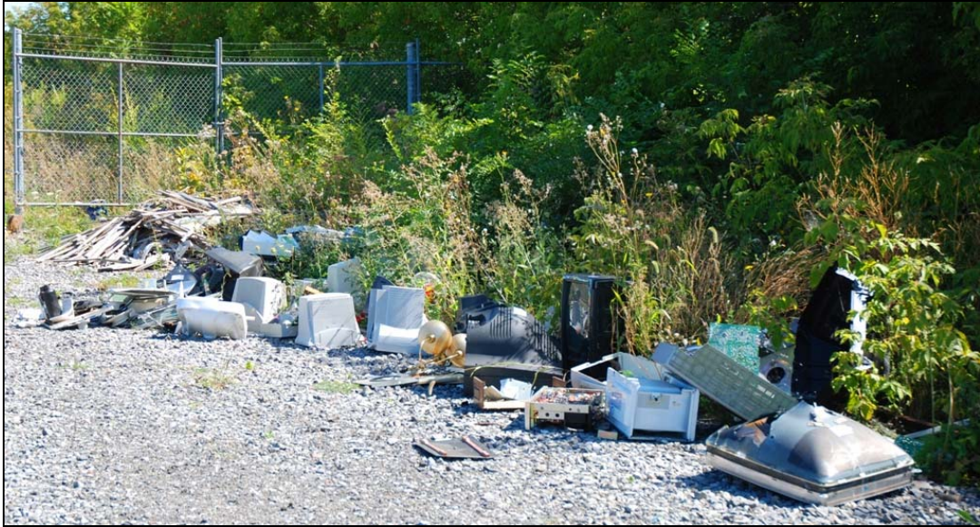
Derrière une clôture rue Sébastopol, 2009-septembre-12 : dépôt sauvage?

Outre les vestiges ferroviaires et les immondices accumulées le long des clôtures, je n'ai repéré qu'un seul tas d'ordures suspect. Le quartier a plus que sa part de déchet industriel. Il n'est pas nécessaire d'en rajouter. Il faut veiller à ce que ça ne se produise pas.