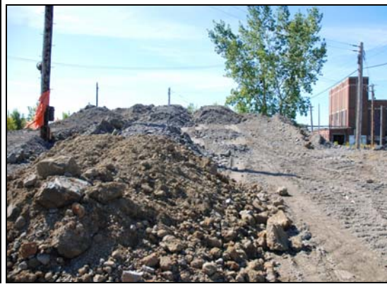
Travaux, 2009-septembre-19 : le tas, prise 1, prise 2.