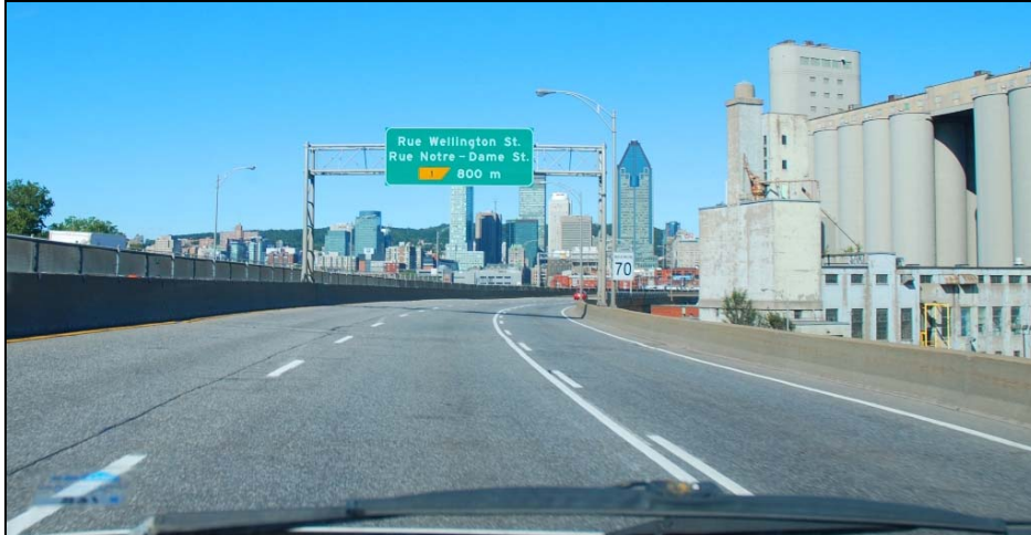
Voies rapides surélevées, 2009-septembre-16 : Une disparition qui va libérer de l'espace pour du tissu urbain vivant.

À l'est et au sud, le réaménagement de l'autoroute Bonaventure va modifier significativement la donne.