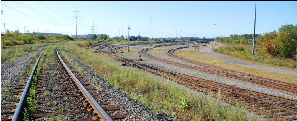
Sur les lieux de travail, 2009-septembre-19 : Autour des voies utilisées, tout est dégagé.

La partie utilisée des installations est bien maintenue. Il y a quelques amas de matériaux divers, mais le tout est sécuritaire puisque la vue est dégagée autour des rails.