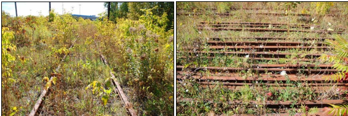
Sur le site pour développement, 2009-septembre-19 : rails et rails.