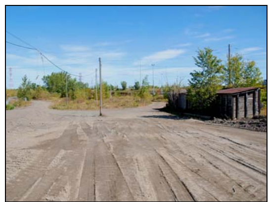
Travaux, 2009-septembre-19 : Le but semble être d'enterrer un sol négligé sous une terre grise.

Il serait dommage de ne pas profiter de cette occasion pour enlever les sols impropres. C'est une bombe à retardement, que nous laissons en héritage aux générations futures.