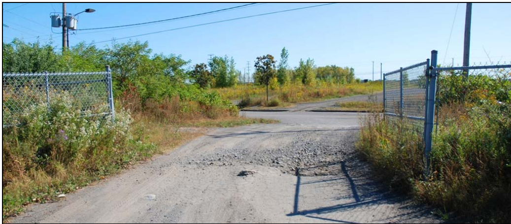
Accès au site, 2009-septembre-16 : Sortie des camions sans camion.