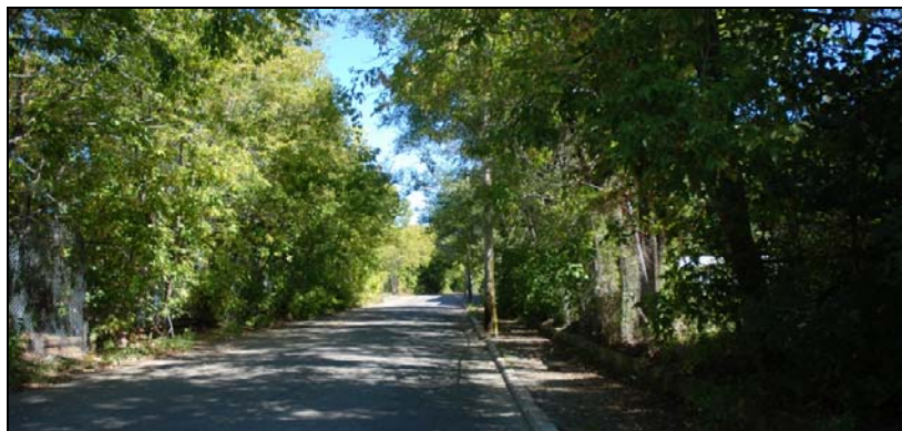
Rue Sébastopol, 2009-septembre-12 : Une bonne candidate pour une piste cyclable.