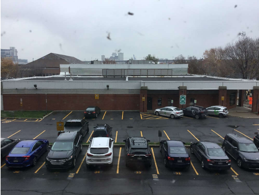
Vue générale du bâtiment (secteur toit bas)