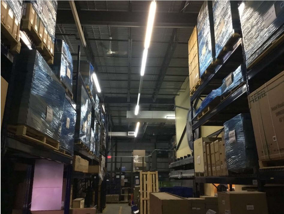
Secteur toit haut