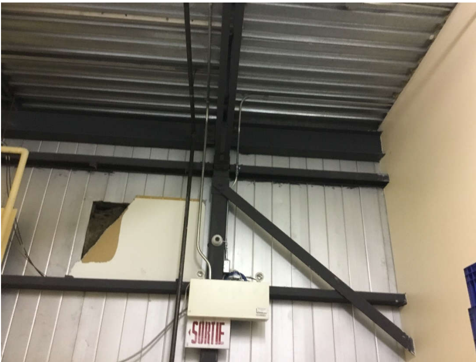
Poutre de rive et contreventement