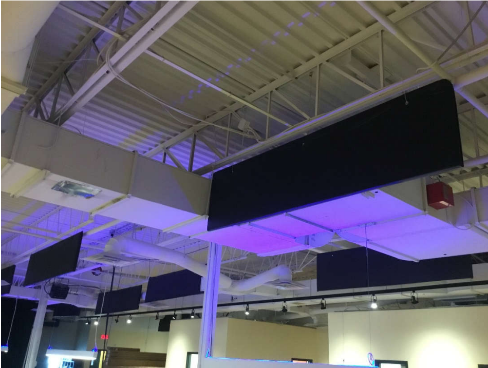
Secteur toit bas