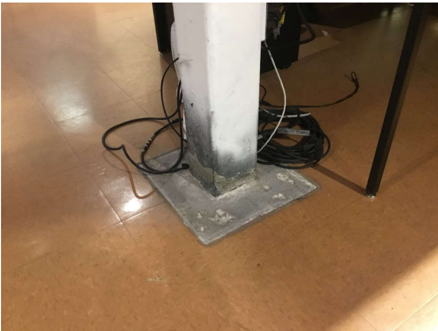
Colonne sur semelle isolée