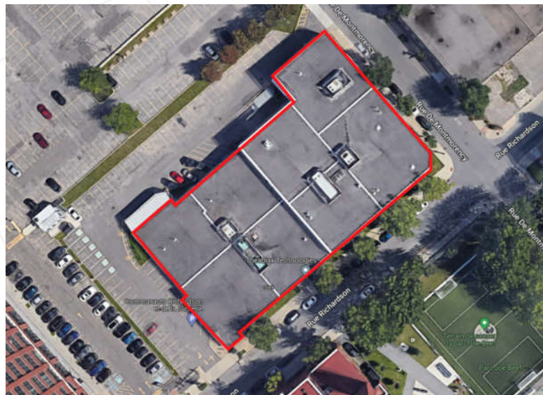
Vue en plan du bâtiment cité au rapport

Ce rapport d'état sommaire du bâtiment situé au 1655 Richardson, fait suite à l'acceptation de notre offre de services visant à définir l'état général du bâtiment et les possibilités de réutilisation comme partie intégrante d'un nouveau projet comportant l'ajout de plusieurs étages supplémentaires.